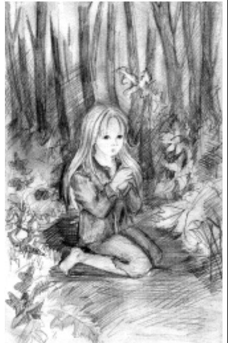
Цири из романа "Ведьмак" (Багира)

Мы мечтаем, а наши художники сразу же воплощают наши мечты в своих рисунках.